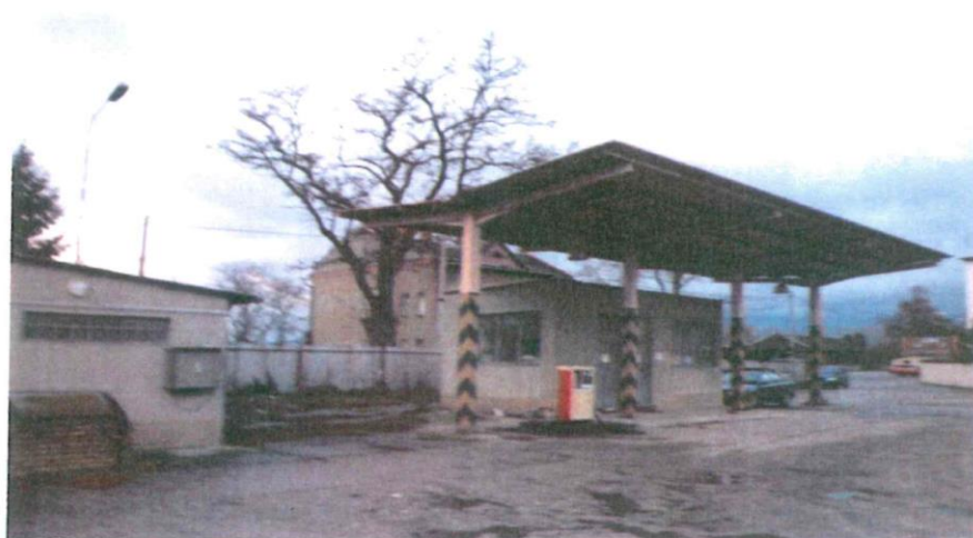
Pohled na zpevněnou plochu